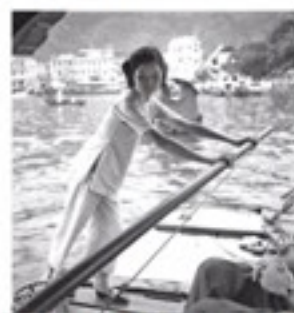
Raymond Cauchetier 《香港仔》(1954年)