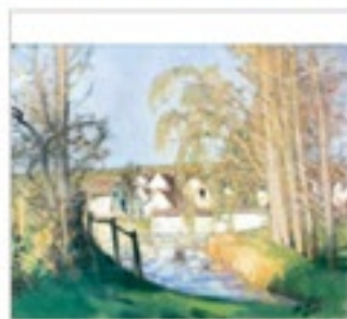
奧地利·尤金·莫特尊 《Les Osmeaux 的磨坊》