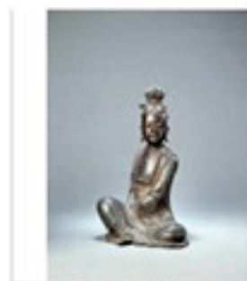
現代青銅藝術坐像