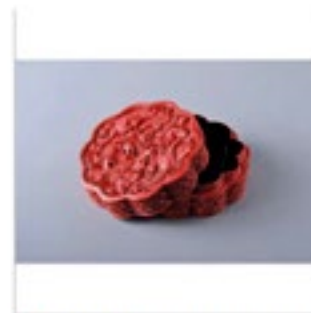
清代制紅糖或裝飾寶盒 (18世紀)

除了畫作、古董外，典亞藝博於去年增設攝影專區，反應熱烈，今年更是全面擴展，展出一系列來自世界各地頂級藝廊的經典藝術攝影，例如 Zen Foto Gallery 會展出日本攝影師荒木經惟的復古藍銀沖印作品及其他收藏級攝影圖書；Blue Lotus Gallery 會帶來本港攝影大師黃電影導演何藩 (1931~2016) 的街頭攝影作品；Novalis Contemporary Art + Design 則展出意大利攝影師 Valentina Loffredo 的近作；至於 Boogie Woogie Photography 的展品出自法國攝影大師 Raymond Cauchetier，是一輯攝於香港及澳門的珍貴藍銀沖印作品，此前更是從未面世呢！