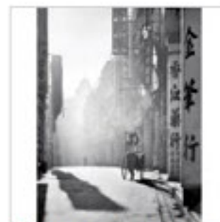
何藩《A Day is Done》(1967年)