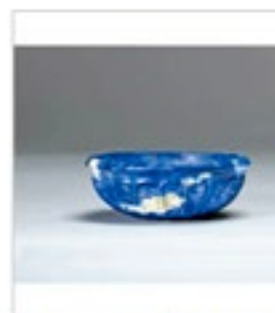
伊納阿契德尼得寶金石碗 (公元前5~4世紀)