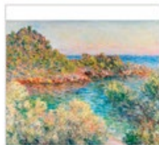
莫奈《蒙特卡洛近郊》(1883年)

展品類別方面，以「印象派、現代及當代藝術」最受注目，尤其是 Gladwell & Patterson 帶來的莫奈 (1840~1926) 油畫—《蒙特卡洛近郊》與《蓮池》，更是不容錯過！《蒙特卡洛近郊》是莫奈於法國南部首先繪畫的畫作之一，畫面中可見耀眼的光影與閃爍的陽光互相交織，體現藝術家描繪光影的卓越功架。《蓮池》則是莫奈晚年的一幅代表作，描繪其西維尼家園的睡蓮花池，顯示出非凡的創造力。