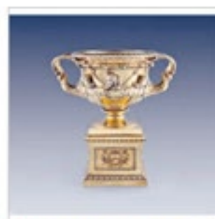
喬治三世威靈頓公爵及加爾比爾獎盃 (1819~1821)