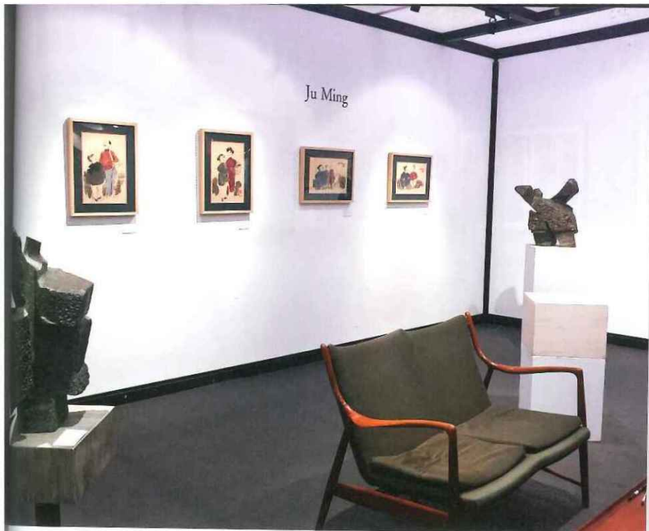
左 漢雅軒帶來朱銘銅塑太極系列、字畫及書法創作等作品。(漢雅軒提供) 下 朱銘的銅太極雕塑，充滿了空間感和動勢。(漢雅軒提供)